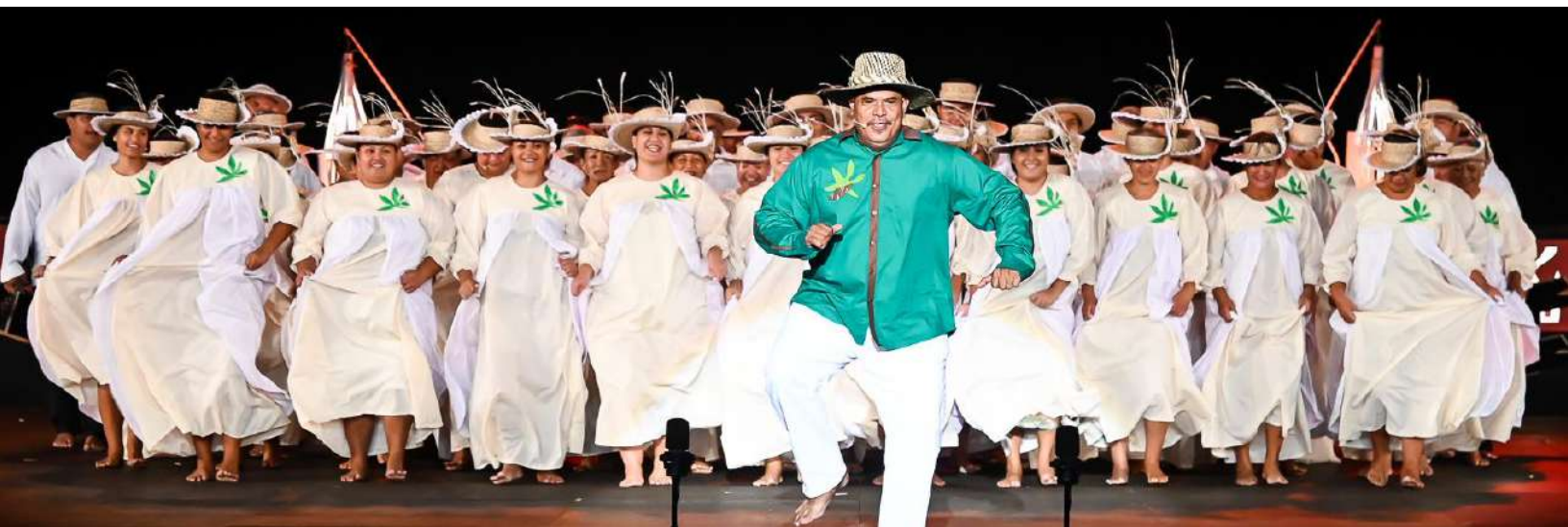
Heiva i Tahiti 2023 – Groupe Nuna'a Rurutu